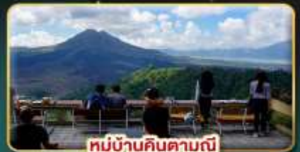
หมู่บ้านคินตามณี