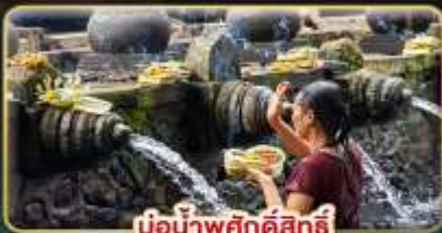
บ่อน้ำพุศักดิ์สิทธิ์