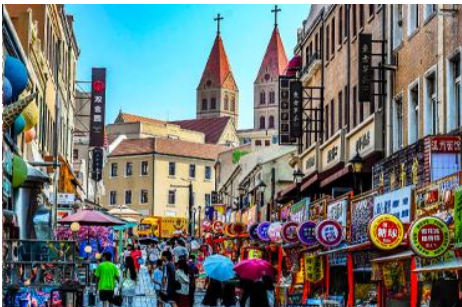
ถนนจงซาน

นำท่านเดินทางชม สะพานจ้านเจียว 栈桥 เป็นแลนด์มาร์กแห่งประวัติศาสตร์คู่เมืองชิงเต่า สร้างเมื่อปี ค.ศ.1891 มีลักษณะเป็นสะพานหินทอดยาวกว่า 440 เมตรสู่ทะเล ปลายสะพานมีศาลา ทรงแปดเหลี่ยมสีแดงที่โดดเด่น ซึ่งเป็นสัญลักษณ์บนฉลากเบียร์ชิงเต่า ขึ้นชื่อเรื่องวิวสวย รับลมทะเล ให้ท่านเก็บภาพบรรยากาศ