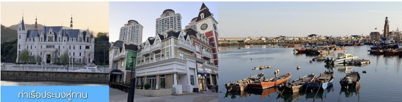
ท่าเรือประมงหู่กาน

พักที่ DALIAN JUZISHUIJING HOTEL หรือ โรงแรมระดับ 4 ดาวท้องถิ่น เมืองต้าเหลียน