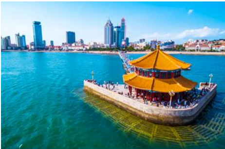
สะพานเจียนเจียว

หลังอาหารนำท่านสัมผัสสมนต์เสน่ห์ของหมู่บ้านชาวประมง ซาจื่อโจว 沙子口渔村 ให้ท่านได้ชมวิถีชีวิตดั้งเดิมกับทิวทัศน์ชายทะเล วิถีบ้านเรือนหลากสีที่ตั้งเรียงรายตามแนวชายฝั่งที่โดดเด่นด้วยเอกลักษณ์ ทำให้ หมู่บ้านซาจื่อโจว เป็นเอกลักษณ์เป็นจุดถ่ายภาพราวกับเมืองชายฝั่งของอิตาลีในยุโรป, จึงเป็นที่ดึงดูดให้นักท่องเที่ยวต่างอยากมาสัมผัสบรรยากาศ ณ หมู่บ้านชาวประมงซาจื่อโจวแห่งนี้