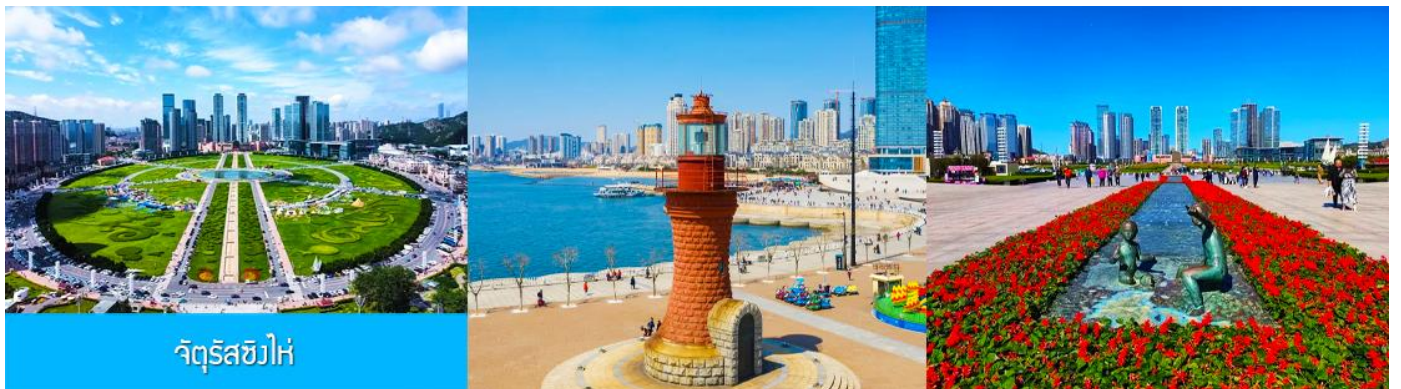
จัตุรัส星海

จากนั้นนำท่านเที่ยวชมและเก็บภาพ ณ พิพิธภัณฑ์ประวัติศาสตร์หลู่ซุ่น 旅顺博物馆 เป็นอาคารพิพิธภัณฑ์เก่าแก่อายุกว่าร้อยปีแห่งแรกที่ยังคงสภาพเดิมที่สร้างขึ้นทางภาคตะวันออกเฉียงเหนือของจีน อาคารพิพิธภัณฑ์มีความโดดเด่นด้วยสถาปัตยกรรมแบบกรีกโรมันยุคเรเนซองส์ ผสมผสานสถาปัตยกรรมแบบตะวันตก ภายในมีการจัดแสดงโบราณวัตถุกว่า 60,000 ชิ้น ท่านสามารถเก็บภาพที่ระลึกด้านหน้าอาคารพิพิธภัณฑ์ และสามารถเข้าชมโบราณวัตถุภายในพิพิธภัณฑ์ได้ตามอัธยาศัย (พิพิธภัณฑ์ปิดทุกวันจันทร์)..