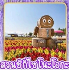
สวนชิโกะโนะโอะกะ