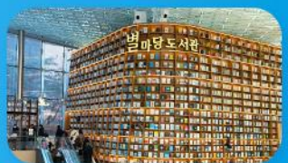
ห้องสมุดสตาร์ฟิว