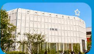
บรักลิเนกาหลี่