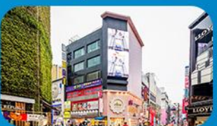
ช้อปปิ้งย่านเมียงดง