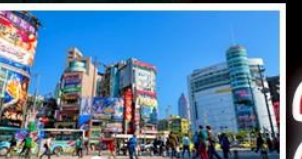
ซ้อปิ้งซีเหมินตง