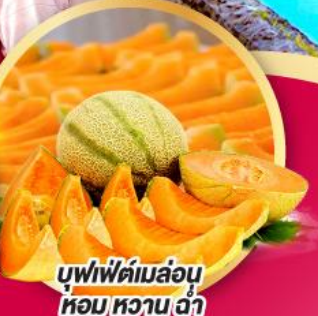
บุฟเฟ่ต์เมล่อน หอมหวานฉ่ำ