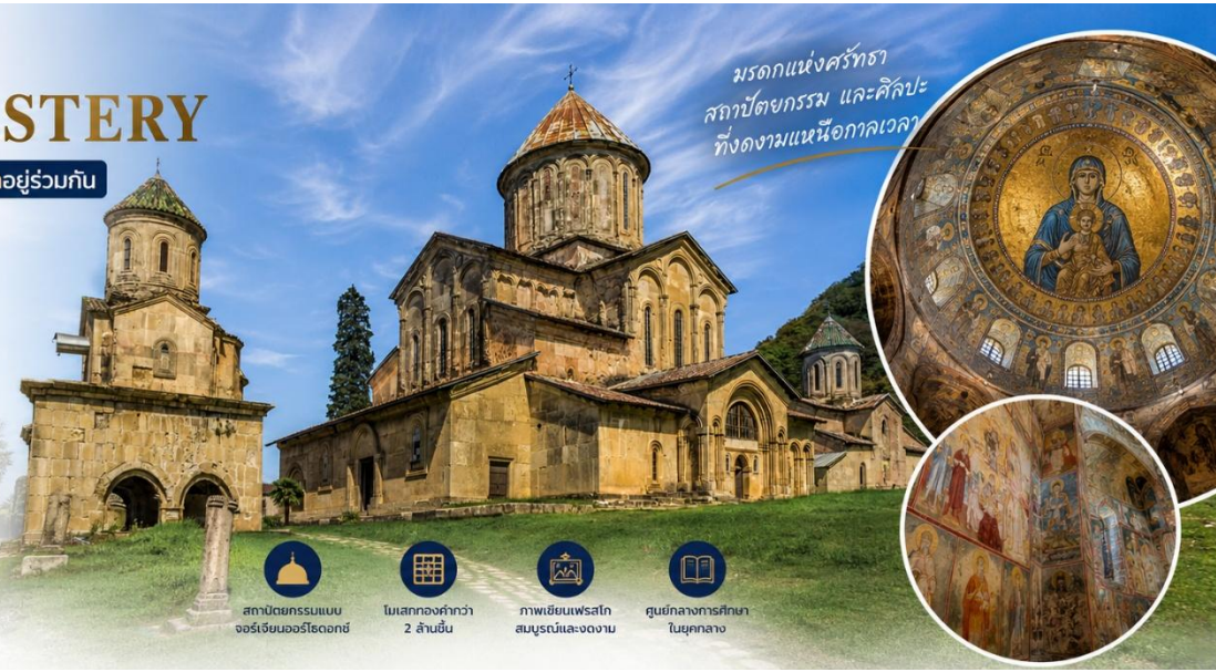
มรดกแห่งศรัทธา สถาปัตยกรรม และศิลปะ ที่งดงามเหนือกาลเวลา