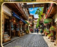
เดินเล่นย่านเมืองเก่า บรรยากาศย้อนยุค