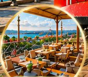
Seven Hills Cafe ชมวิว อิสตันบูล