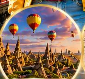
เมืองคัปปาโดเกีย Cappadocia