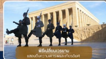
พิธีเปลี่ยนเวรยาม แสดงถึงความเคารพและเกียรติยศ

ได้เวลาเดินทางทางสู่เมือง "ซาฟรานโบลู" (Safranbolu) คือเมืองท่องเที่ยวที่มีชื่อเสียงของจังหวัดการาบิก (Karabük) ในภูมิภาคทะเลดำตุรกี เป็นเมืองที่มีความสำคัญทางด้านประวัติศาสตร์ของประเทศ ตุรกี โดยเฉพาะชื่อเสียงเกี่ยวกับสถาปัตยกรรมซาฟรานโบลู ที่มีอิทธิพลต่อพัฒนาการชุมชนเมืองทั่วทั้งจักรวรรดิออตโตมัน ต่อมาในปี 1994 เมืองซาฟรานโบลู ได้ถูกองค์การยูเนสโกยกให้เป็นมรดกโลกทางด้านวัฒนธรรม