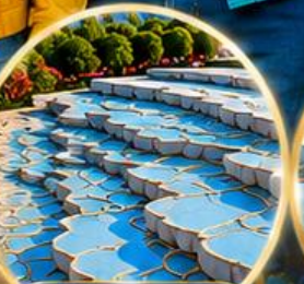
ปามุกคาล์ Pamukkale