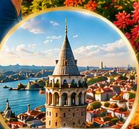
หอคอยกาลาตา Galata Tower