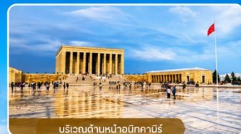
บริเวณด้านหน้าอนุสาวรีย์

สถานที่สำคัญที่คนตุรกีให้ความเคารพและจดจำผู้นำผู้ยิ่งใหญ่ ที่อุทิศทั้งชีวิตเพื่อชาติ ศาสนา และประชาชน