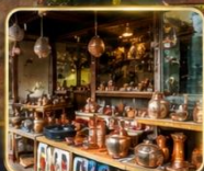
เลือกซื้อของฝาก งานหัตถกรรมพื้นเมือง

สัมผัสเสน่ห์แห่งอดีตในเมืองที่เวลาเดินช้าลง กับสถาปัตยกรรมอันงดงาม วัฒนธรรมที่ยังคงมีชีวิต และความอบอุ่นจากผู้คน