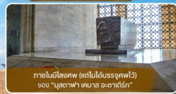
ภายในมีสิ่งศพ (แต่ไม่ได้นำศพไว้) ของ "มุสตาฟา เคมาล อะตาเติร์ก"