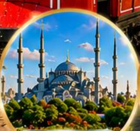
สุเหร่าสีน้ำเงิน Blue Mosque