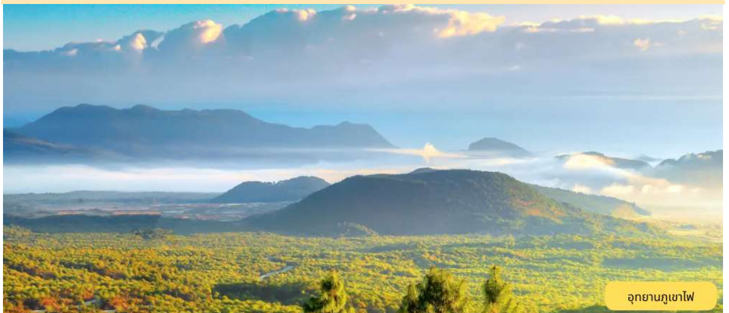
อุทยานภูเขาไฟ

อุทยานภูเขาไฟ (รวมรถราง) - พิพิธภัณฑสถานต่อต้านญี่ปุ่นในสงครามโลกครั้งที่ 2 - นั่งรถสู่เมืองเหมิงซือ - เจดีย์ทอง - เจดีย์เงินของเหมิงซือ - อีสระเดินเล่นที่เมืองโบราณไทยลื้อ