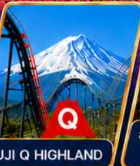
FUJI Q HIGHLAND