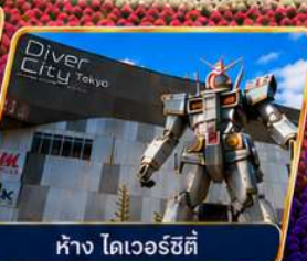
ห้าง ไดเวอร์ซิตี