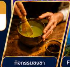
กิจกรรมชงชา