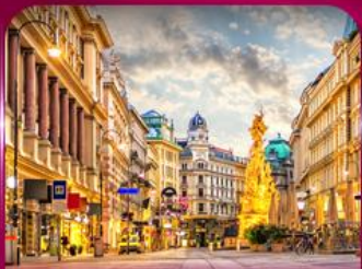
ชมเมืองโรมเนติก เวียนนา