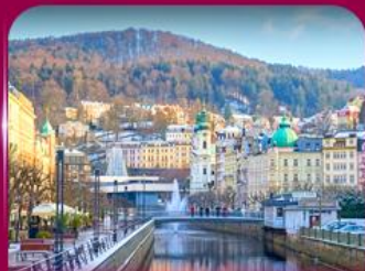
เมืองสปาแสนสวย คาร์โลวี่ วารี