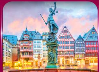
จัตุรัสโรเมอร์ แพรงก์เฟิร์ต