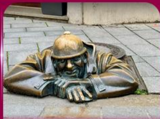
เซลฟี่คูคูมิลา บราติสลาวา