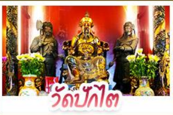
วัดปักโก๊ต