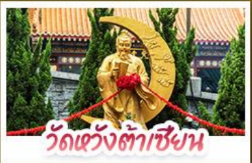
วัดเข่งต้าเซียน