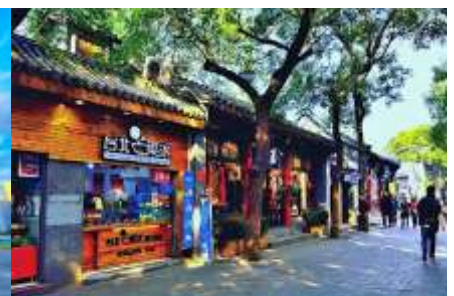
ชอยหนานหลิวกู่ชื่อยี่