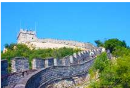
กำแพงเมืองจีนด่านหวยววกวน

พักที่ JINGLIN HTL OR HOLIDAY INN EXPRESS HTL 4* หรือ โรงแรมในระดับเดียวกันในกรุงปักกิ่ง