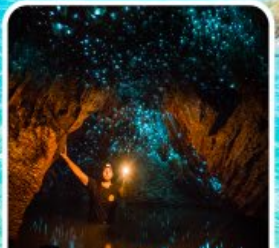
ถ้ำทอนเรืองแสง ไวโตโม