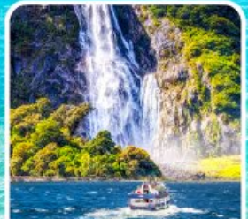
บิลฟอร์ด ซาวด์ นั่งเรือชมความงาม ฟยอร์ด