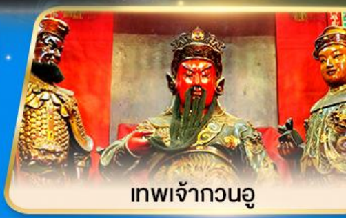
เทพเจ้ากวนอู