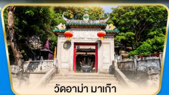
วัดอามา มาเก๊า