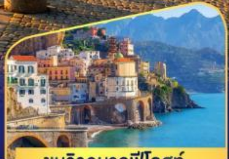
ชมวิวมอลฟีโคสก์