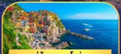
หมู่บ้านมานาโรล่า