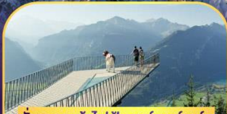
นั่งรถกระเช้าไฟฟ้า ชาร์เตอร์ ดูคัม