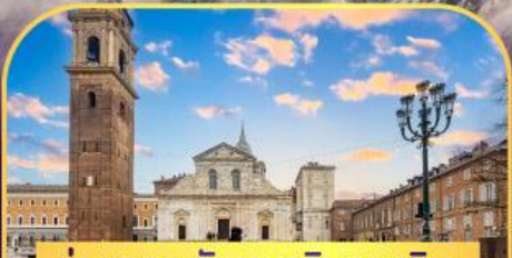
ถ่ายภาพกับมหาวิหารตูริน