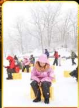
ตกปลาน้ำแข็ง