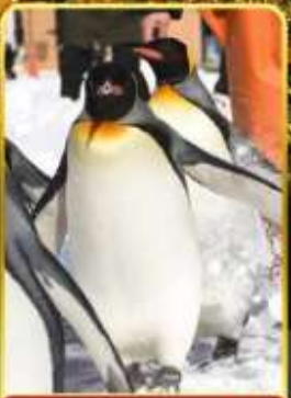
มิถุซามารีนพาร์ค