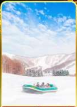
กิจกรรมโนว์ราฟติง