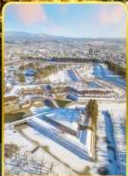
หอดาวห้าแฉก

ออนเซ็น 3 คั้น มน.กระเป๋า 1 ใบ 23 กก 7Days 5Night