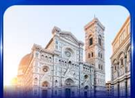
ชมเมืองแห่งศิลปะ ฟลอเรนซ์