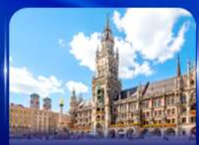
จัตุรัสมาเรียนพลักซ์ มิวนิก