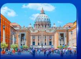
นครรัฐวาติกัน โรม