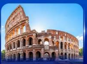
เช็กอินดัง โคโลสซียม โรม