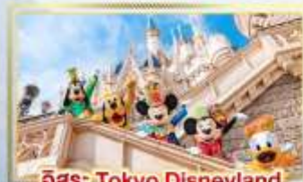
อีสระ Tokyo Disneyland