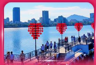
สะพานแห่งความรัก