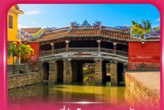
สะพานญี่ปุ่นโบราณ ฮอยอัน