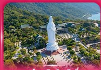
องค์กวนอิม วัดหลันอิ่ง