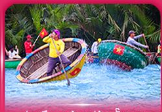
ส่องเรือกระดัง หมู่บ้านกิมทาน