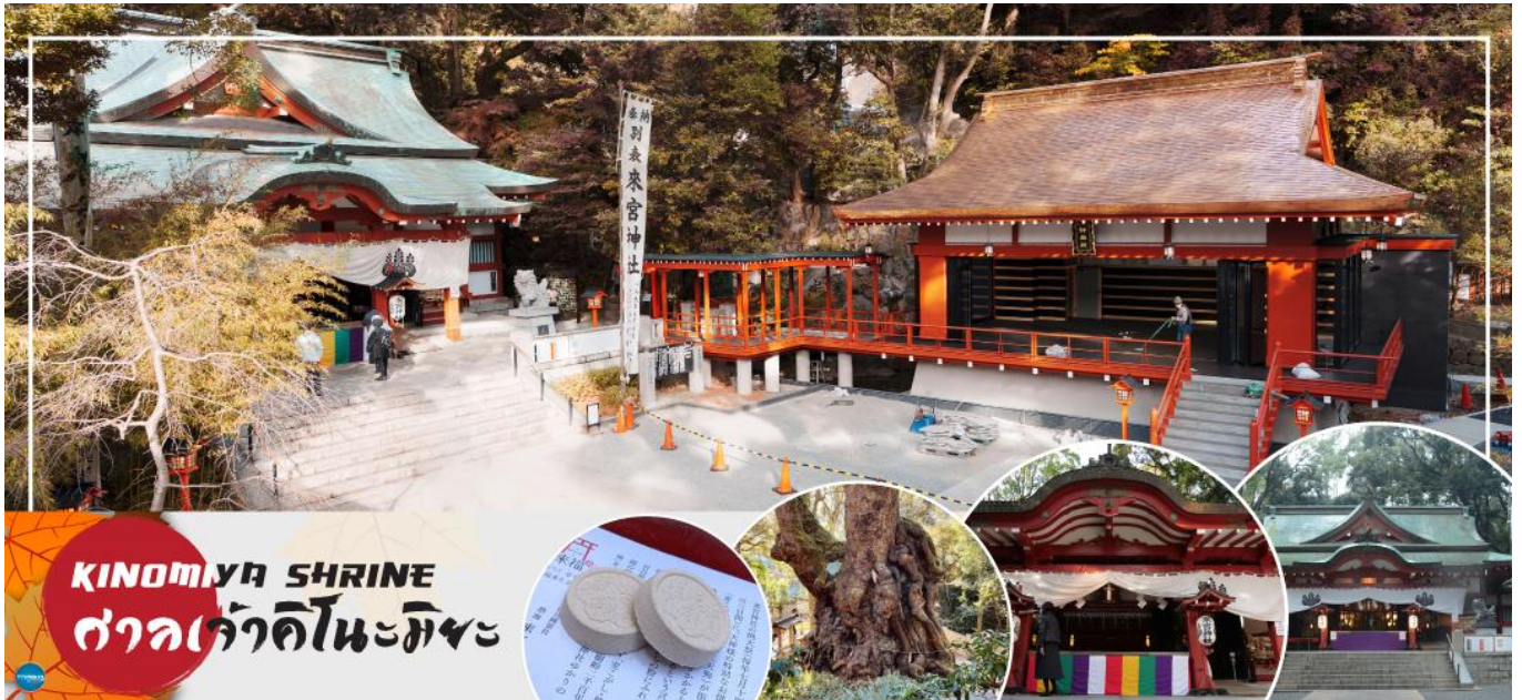
KINOMIYA SHRINE ศาลเจ้าคิโนะมิยะ

เพราะที่นี่ถือเป็นสิ่งสถิตของเทพเจ้าทั้งหลาย ซึ่งในปัจจุบันที่นี้ถือเป็นตัวแทนของศาลเจ้าคิโนะมิยะทั้ง 44 ศาลเจ้าทั่วประเทศ เป็นศูนย์รวมของความเคารพบูชา นอกจากนี้ยังมีอนุสาวรีย์ธรรมชาติแห่งชาติ และยังมีต้นไม้ยักษ์ขนาดเส้นผ่านศูนย์กลาง 24 เมตร ตั้งอยู่ในเขตวัด ว่ากันว่าหากเดินวนรอบต้นไม้หนึ่งรอบ อายุก็จะยาวขึ้นไปอีกหนึ่งปีแม้ที่นี่จะดูน่าเกรงขามแต่พอเข้าไปกลับรู้สึกอุ่นใจ ผู้ที่มาขอให้ตนสามารถเลิกเหล้า เลิกบุหรี่ให้สำเร็จก็มีมาก และยังมีเครื่องรางความรักสุดน่ารักวางขายอีกด้วย