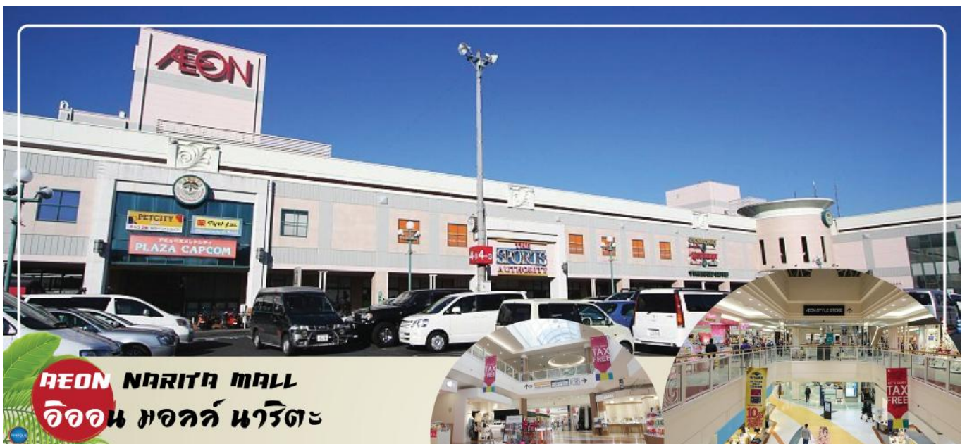
AEON NARITA MALL อโชน มอลล์ นาริตะ

จากนั้นเดินทางสู่ อโชน มอลล์ นาริตะ (Aeon Narita Mall) ห้างสรรพสินค้าที่นิยมในหมู่นักท่องเที่ยวชาวต่างชาติ เนื่องจากตั้งอยู่ใกล้กับสนามบินนานาชาตินาริตะ ภายในตกแต่งในรูปแบบที่ทันสมัยสไตล์ญี่ปุ่น มีร้านค้าที่หลากหลายมากกว่า 150 ร้านจำหน่ายสินค้าแฟชั่น อาหารสดใหม่ และอุปกรณ์ภายในบ้าน นอกจากนี้ยังมีร้านเสื้อผ้าแฟชั่นมากมาย เช่น MUJI, 100 yen shop, Sanrio store, Capcom games arcade และซูเปอร์มาร์เกตขนาดใหญ่