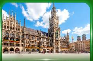
จัตุรัสมาเรียนพลัทซ์ มิวนิก