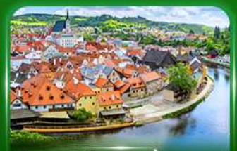
เมืองมรดกโลก เซสกีครุมลอฟ