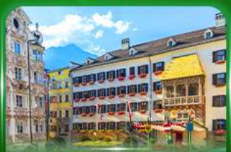
หลังคาทองคำ อินส์บรุค