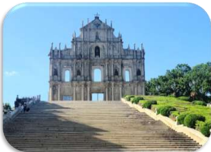
ทางเข้าแผ่นดินใหญ่

จากนั้นนำท่าน เยี่ยมชม มหาวิหารเซนต์พอล (RUINS OF ST. PAUL'S IN MACAU) โบสถ์เซนต์พอลถือเป็นสัญลักษณ์ประจำเมืองมาเก๊า ถูกสร้างขึ้นในช่วงปี ค.ศ. 1602 แล้วเสร็จในปีค.ศ. 1637 ออกแบบโดยพระนิกายเยซูอิตชาวอิตาลี โดยความช่วยเหลือของคริสเตียนชาว ญี่ปุ่น เป็นโบสถ์คาทอลิกที่มีขนาดใหญ่ที่สุดในเวลานั้น ตั้งอยู่ติดกับวิทยาลัยเยซูอิตแห่งเซนต์พอล ซึ่งเป็นสถานศึกษาแห่งแรกของชาวตะวันตกในแดนตะวันออกไกลซึ่งมีขงจื๊อผู้เผยแผ่ศาสนาใช้เป็นี่เรียนภาษาจีนที่มาเก๊าก่อนที่จะเดิน