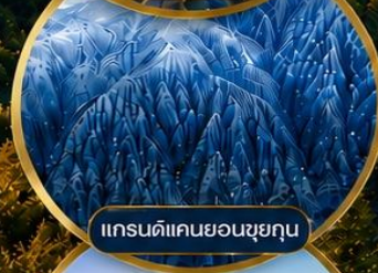
แกรนด์แคนยอนซูยกุน