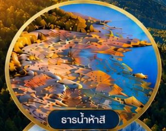
ธารน้ำห้ำสี่