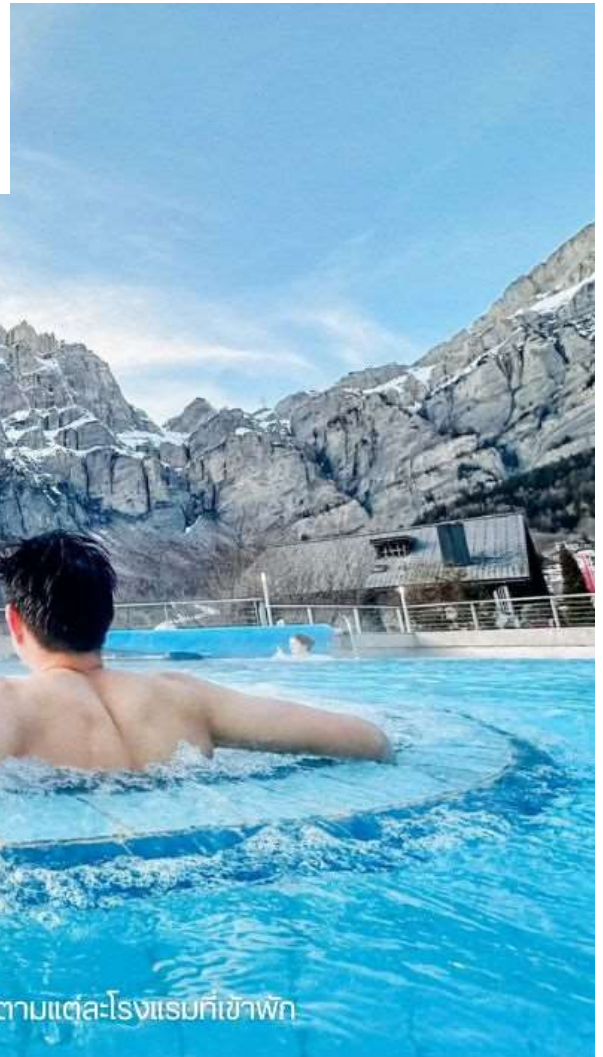
บรรยากาศของบ่อน้ำแร่ อาจจะไม่แตกต่างกันไปตามแต่ละโรงแรมที่เขาพัก

บรรยากาศบ่อน้ำแร่ เมืองลอมบาร์ด บรรยากาศจริงจะมีความแตกต่างไปในแต่ละฤดูกาลท่องเที่ยว