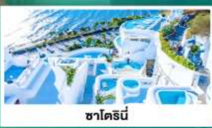
ซาไดร์นี่