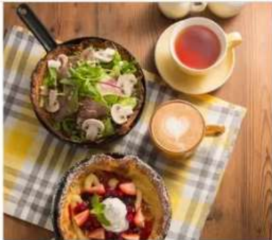
Gourmet Grace Garden Nature Grace Garden 1F[1095]