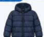
เสื้อขนเป็ด