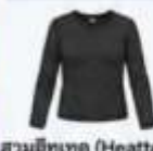
สวมฮีทเทค (Heattech) แบบหนาพิเศษด้านใน