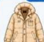
เสื้อโค้ทกันหนาว ตัวหนา