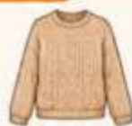
เสื้อไหมพรม