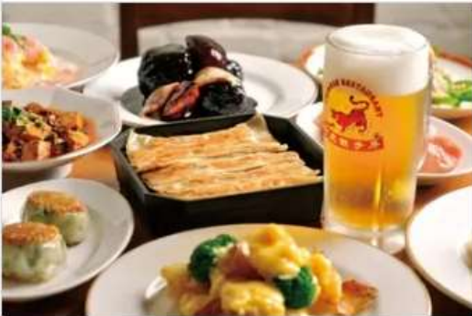
Gourmet BENITORA GYOZABOU 狐虎餃子屋 1F[1092]

นำท่านเดินทางสู่ AEON TOWN SHOPPING MALL ท่านสามารถอิสระซื้อสินค้าทั่วไปของญี่ปุ่นเช่น ขนม, อาหารว่าง, ของเล่น, กระเป๋า, รองเท้า, เสื้อผ้า