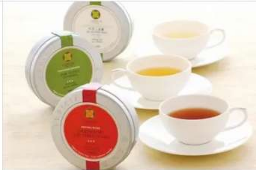
Gourmet LUPICIA LUPICIA 1F[1026]