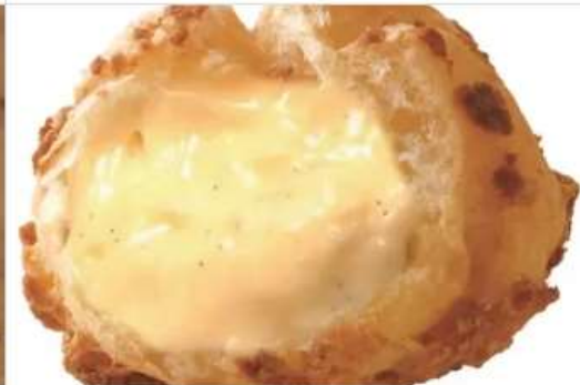
Gourmet Beard Papa 1F[1029]