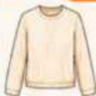
เสื้อแขนยาว