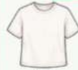
เสื้อยืด