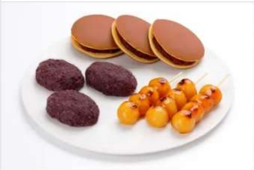
Gourmet KAKIYASU Kofukudo かき屋 1F[1028]