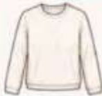
เสื้อแขนยาว