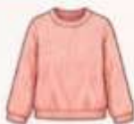
เสื้อสเวตเตอร์ถัก หรือคาร์ดิแกน