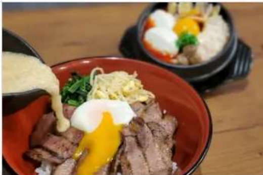
Gourmet MUGITORO & HAN 1F[1081]