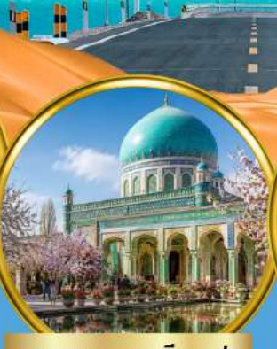
สุสานสมหอมเซียนเฟย