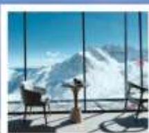
4860 COFFEE SHOP