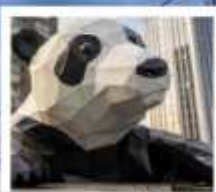
ห้าง IFS หนีเฟินต้ายัก