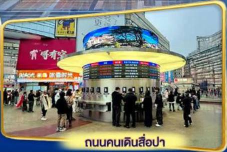
ถนนคนเดินสี่ปา