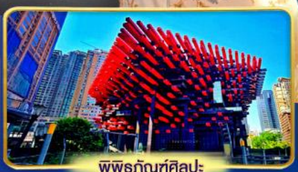
พิพิธภัณฑ์ศิลปะ