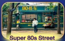
Super 80s Street