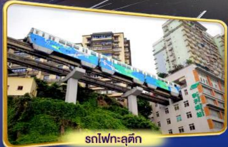
รถไฟฟ้าลัดติง