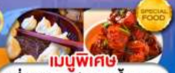
เมนูพิเศษ เสี่ยวหลงเปา หมูน้ำแดง เดินทาง ต.ค. 69 - มี.ค. 70