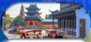
Zhujiajiao Ancient Town ล่องเรือเมืองโบราณ

เซี่ยงไฮ้ ดิสนีย์แลนด์ เมืองโบราณจูเจียเจียว