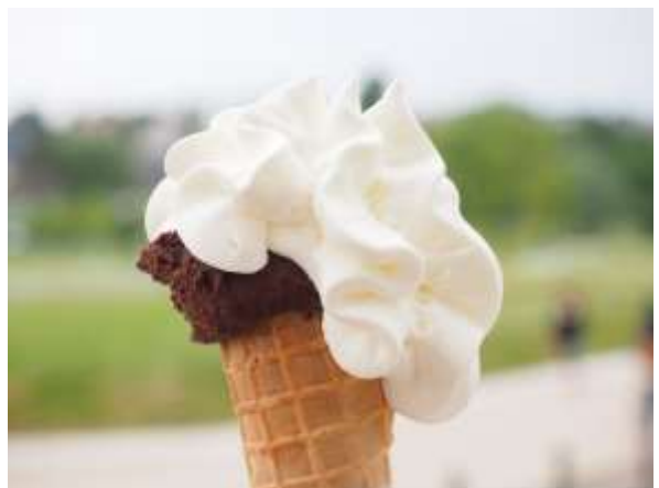
ภาพประกอบเท่านั้น