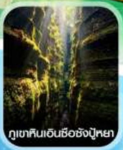
ภูเขาหินเอ็นชื้อซังปู้หยา