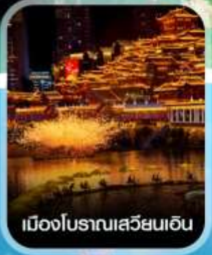
เมืองโบราณเสวียนเอ็น