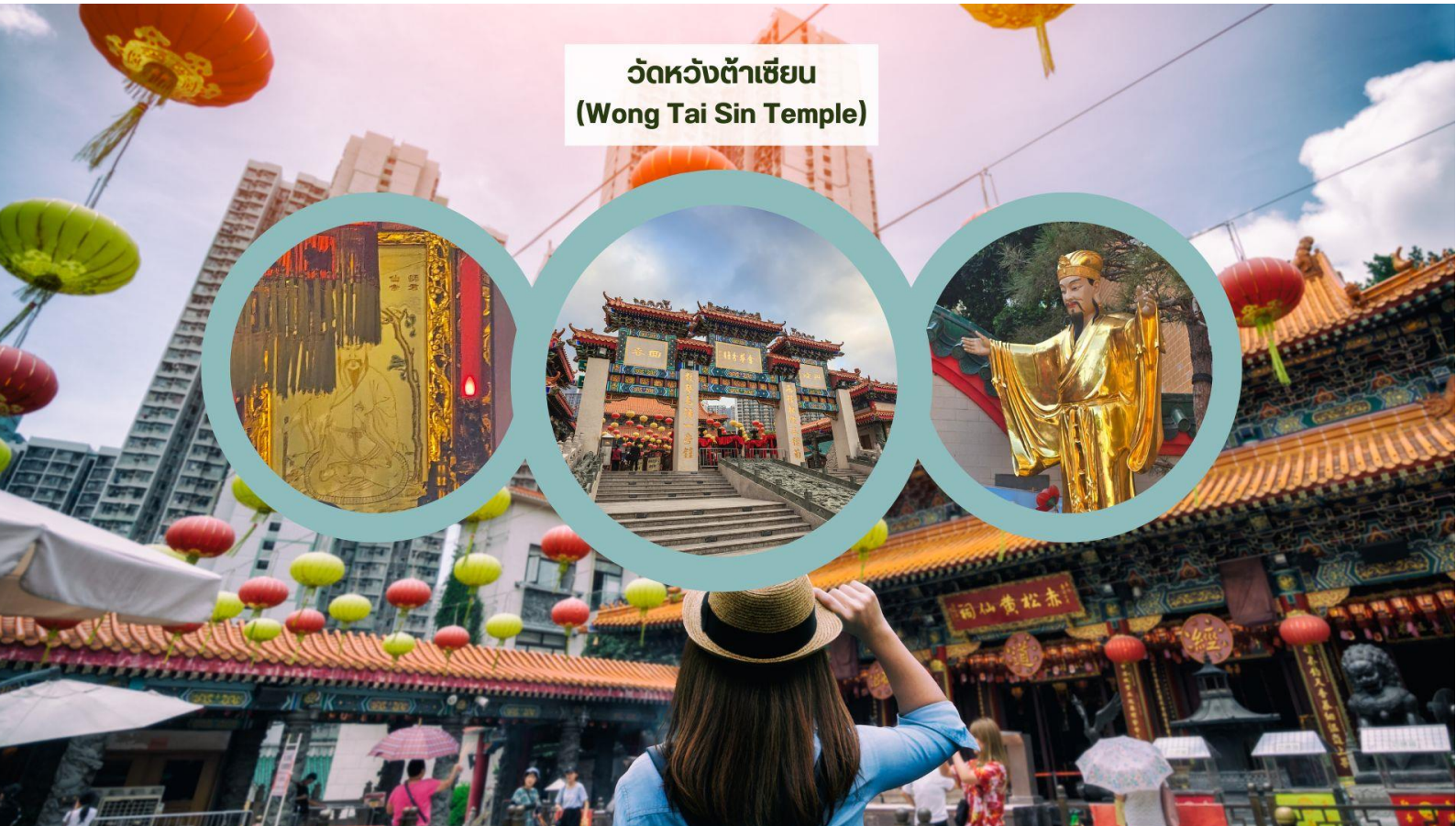
วัดหวังต้าเซียน (Wong Tai Sin Temple)

เช้า รับประทานอาหารเช้า ณ ภัตตาคาร บริการท่านด้วยเมนูติ่มซำฮ่องกง (มื้อที่ 3)