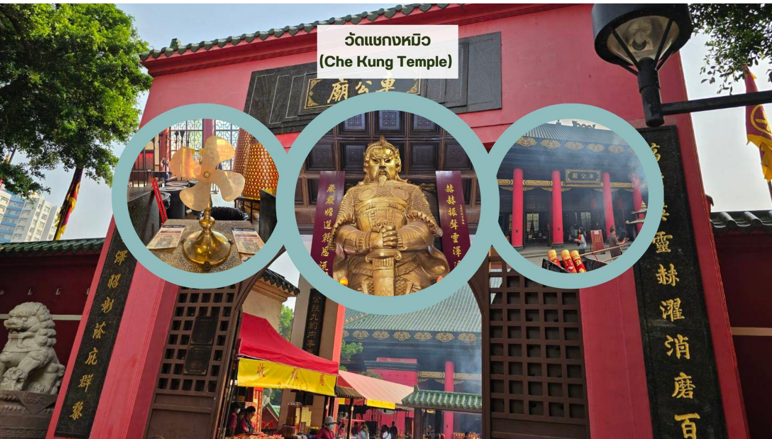
วัดแขกหมิว (Che Kung Temple)

จากนั้นนำท่านเดินทางสู่ วัดแขกหมิว หรือ วัดกังหัน (Che Kung Temple) ขอพรเรื่องการเดินทางปลอดภัย สุขภาพแข็งแรง โชคลาภ และเงินทอง วัดตั้งฮ่องกงที่ตั้งมาถึงเมืองไทย เป็นวัดที่มีประวัติศาสตร์ยาวนานกว่า 300 ปี ภายในวัดมีรูปปั้นสีทองเหลืองอร่าม ตั้งตระหง่านทั้งซ้ายและขวา เป็นวัดศักดิ์สิทธิ์ที่มีความเชื่อในเรื่องกังหันลม โดยความหมายของใบพัดทั้ง 4 คือ เดินทางปลอดภัย อายุยืนยาว เงินทองไหลมาเทมา และสมปรารถนาทุกประการ หากหมุนกังหันตามเข็มนาฬิกา 3 รอบ จะพัดพาเอาสิ่งไม่ดีออกชีวิต และนำสิ่งดีๆ เข้ามาแทน