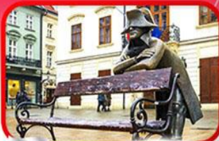
ย่านเมืองเก่าราติสลาวา

เที่ยวเมืองสวยริมทะเลสาบ ฮัลล์สตัดท์ • ชมเมืองไข่มุกแห่งโบฮีเมีย เซสกี กรุงลอน • ปราก • เวียนนา • ซอปปิงพาร์นดอร์ฟ เอาก์เล็ท