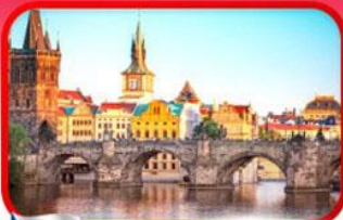
เขื่อนอินสพานชาร์ลส์