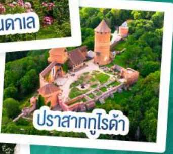
ปราสาทกูไรต้า