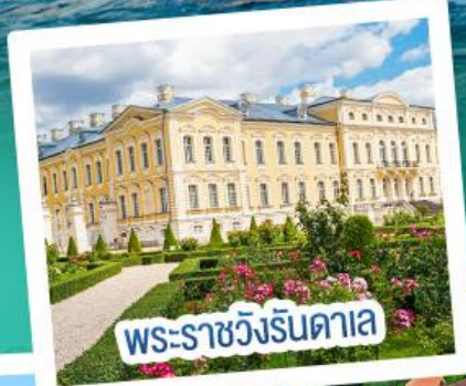
พระราชวังรินดาเล