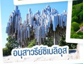
อนุสาวรีย์ซีเบลิอุส